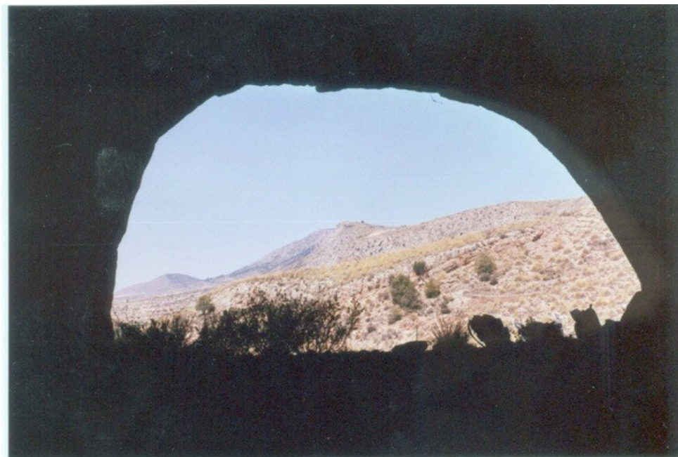
Vista desde el interior de la cueva