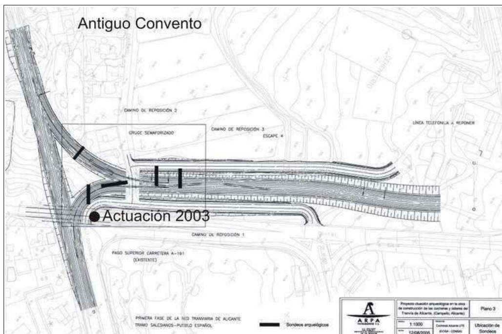
Situación sondeos sobre la obra