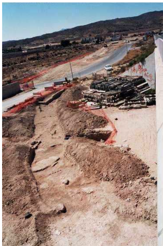
Vista de la actuación