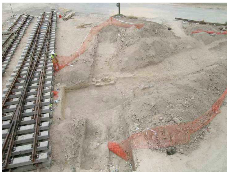
Zona con restos de estructuras romanas arrasadas