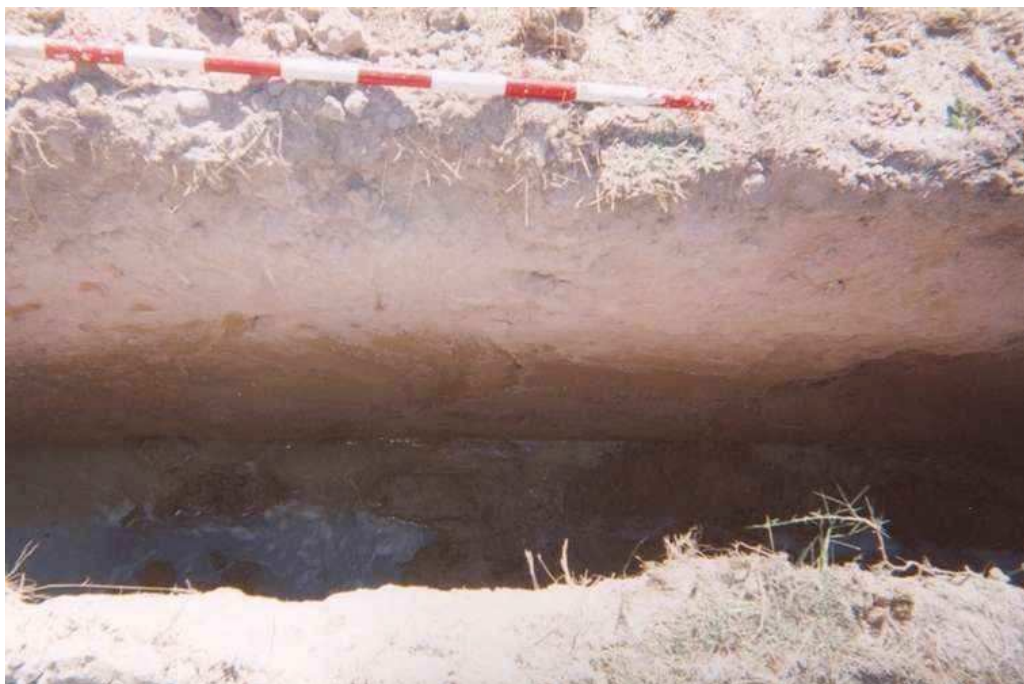
Vista del perfil del sondeig 3