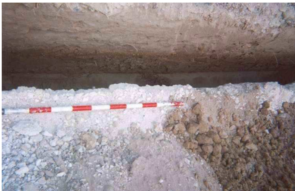
Vista del perfil del sondeig 7