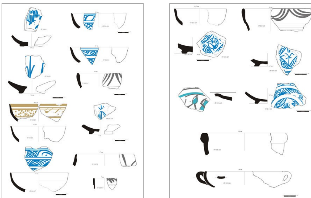
Cerámica de cronología bajomedieval