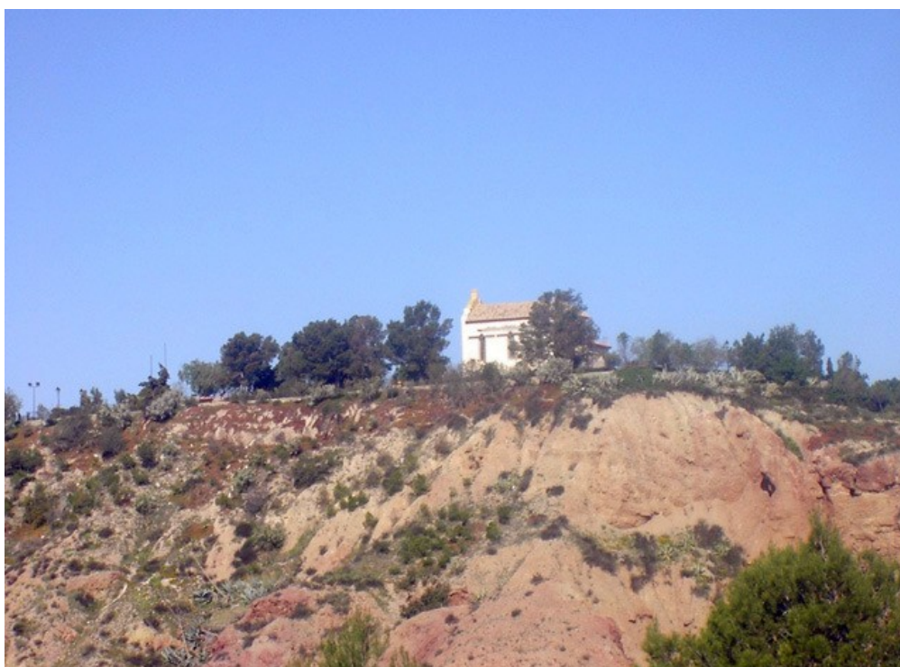
Emplazamiento de la ermita del castillo

No obstante, la comprobación de la existencia de niveles arqueológicos fiables, así como la constatación de estructuras y muros en el subsuelo del recinto hacen que se efectúe la protección necesaria en el recinto delimitado como Castell de Finestrat, adecuando su catalogación como bien de interés cultural.