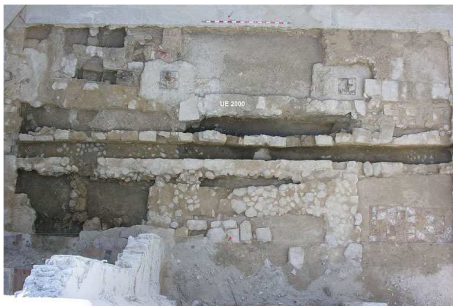
Vista general de la excavación