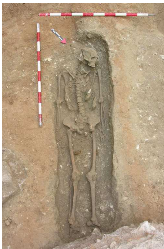
Inhumación hallada en la excavación