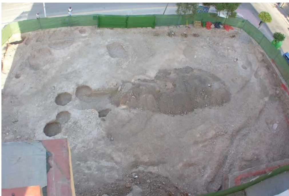
Vista aérea del solar una vez finalizada la intervención