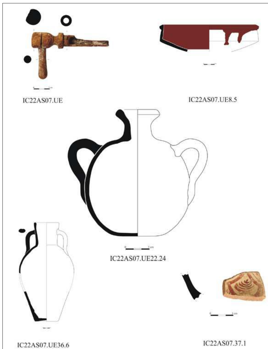
Ejemplo de materiales exhumados en la excavación