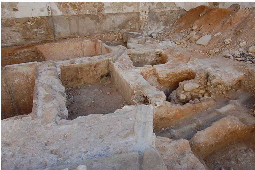
Vista general del lagar