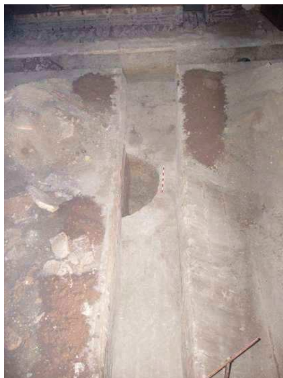
Detalle de uno de los sondeos arqueológicos