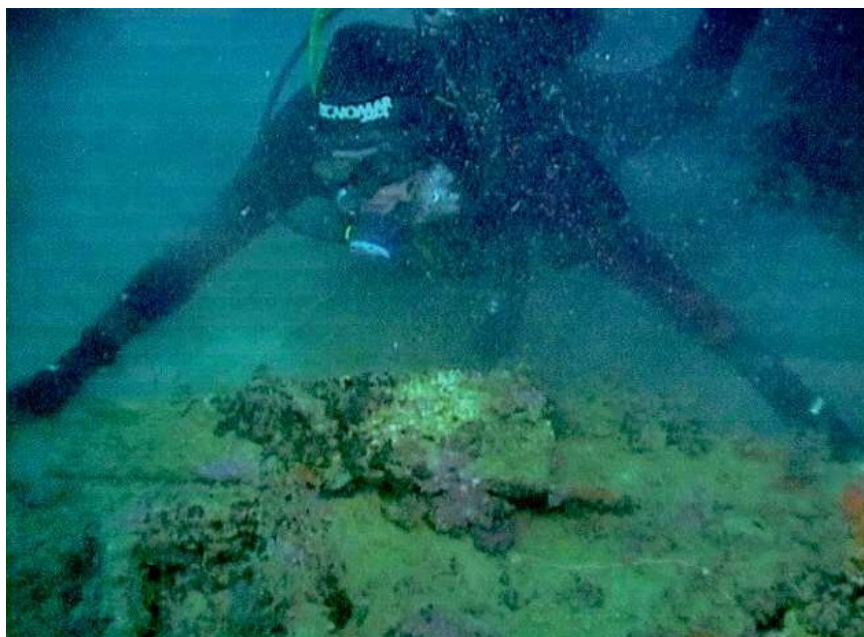
Vista del cepo sumergido