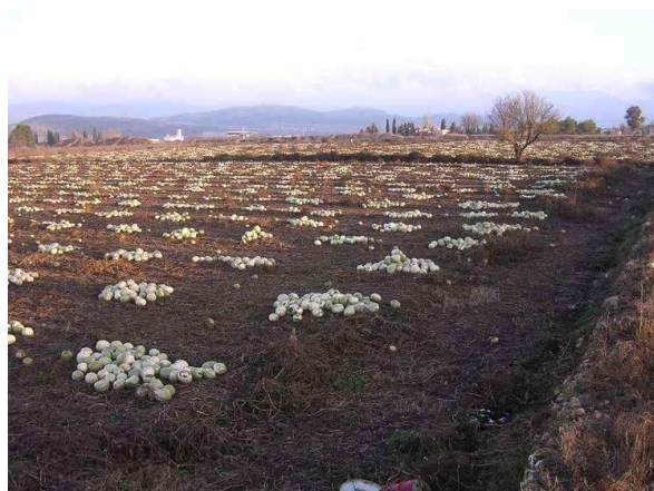
Vista general de la parcela 207