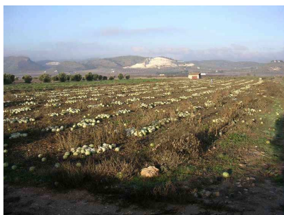
Vista general de la parcela 215