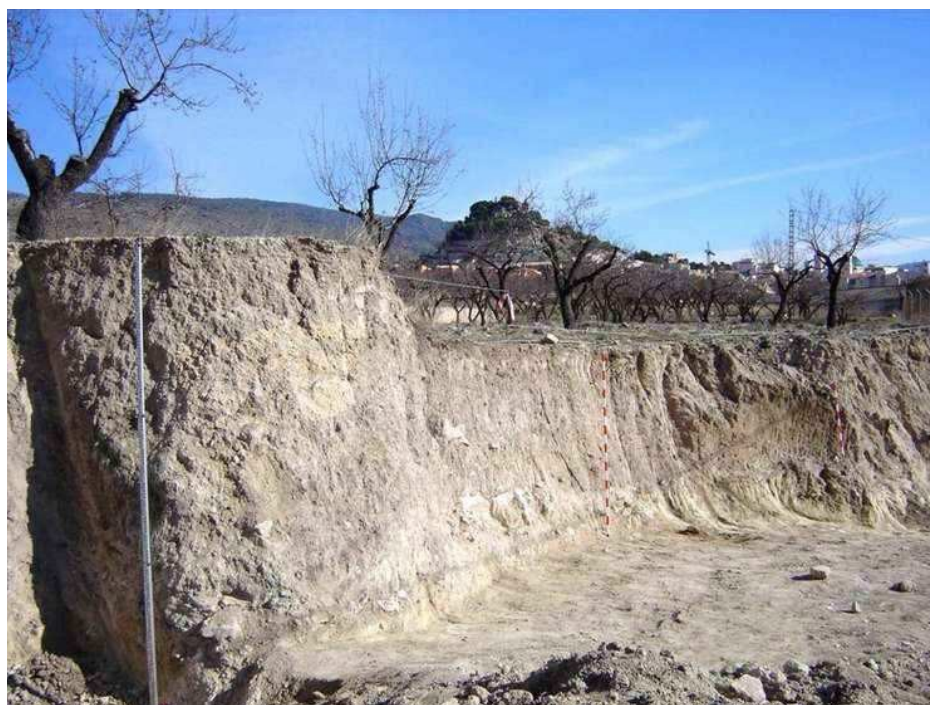
Perfil antes de los trabajos de excavación

LLOBREGAT CONESA, E. A. (1972): Contestania ibérica , Instituto de Estudios Alicantinos. Diputación Provincial de Alicante, Alicante.