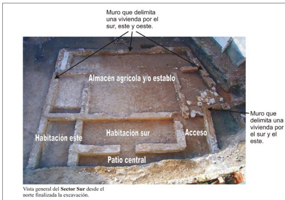
Vista general del Sector Sur desde el norte finalizada la excavación