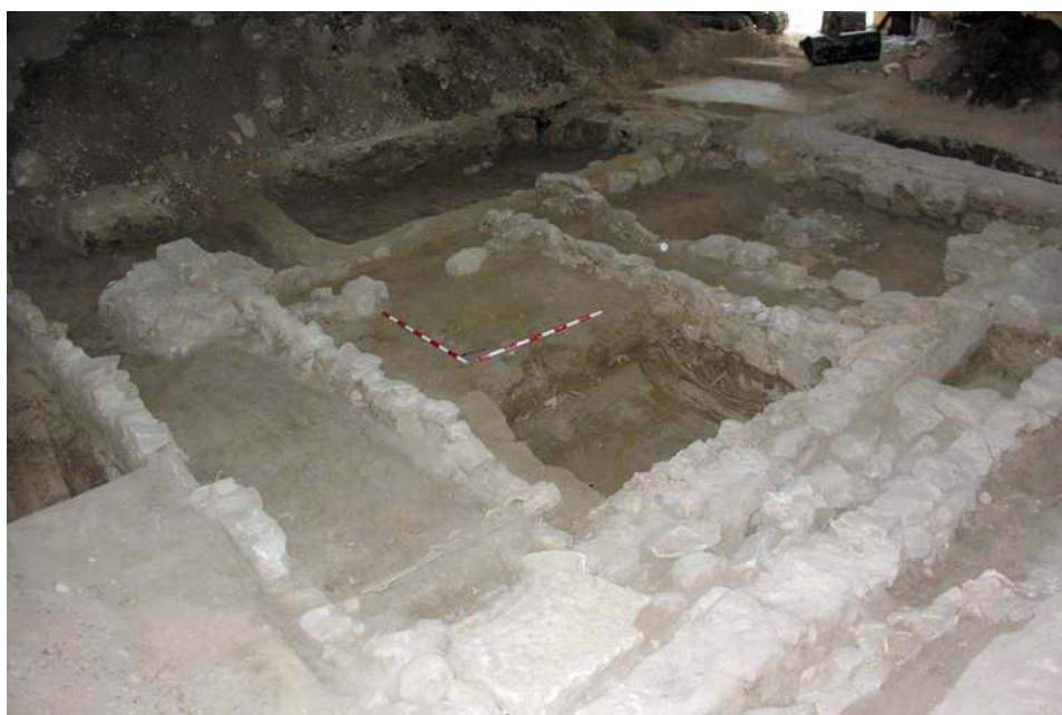
Vista general del solar al final de la intervención