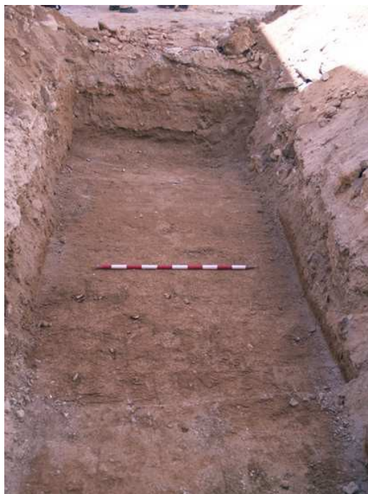
Sondeo tras la intervención arqueológica