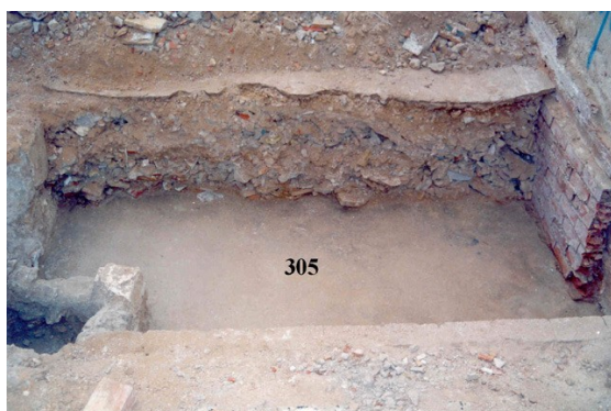
Unidad estratigráfica 305