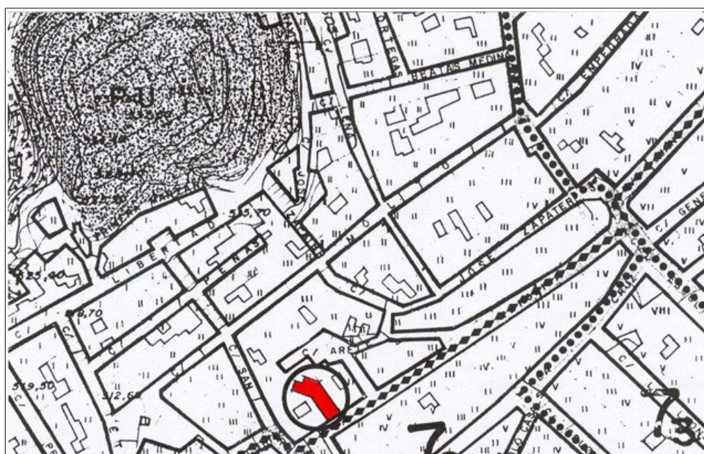
Localización del solar en el centro histórico de Villena

En cuanto a los muros que delimitan el solar hay que decir que por su desarrollo y factura en ninguno de los casos aprovechan estructuras medievales. Todo parece indicar que la primera construcción en ese punto de la calle de la Verónica data de mediados del siglo XIX.