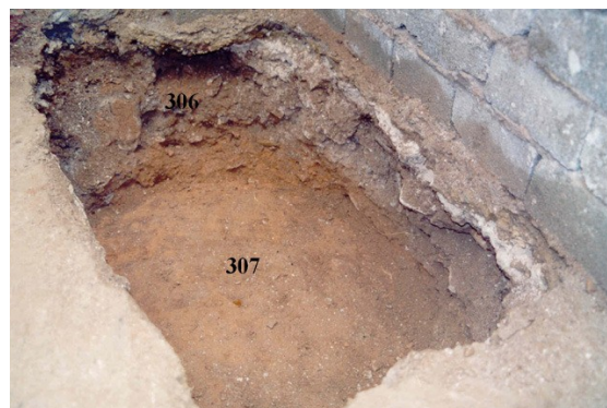
Unidades estratigráficas 306 y 307