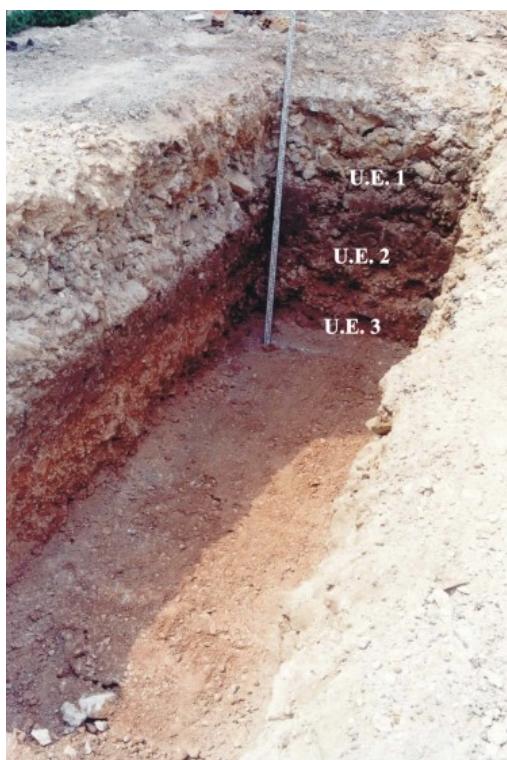
Detalle de la estratigrafía