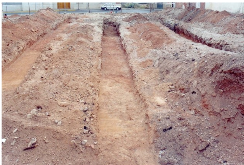
Realización de los sondeos