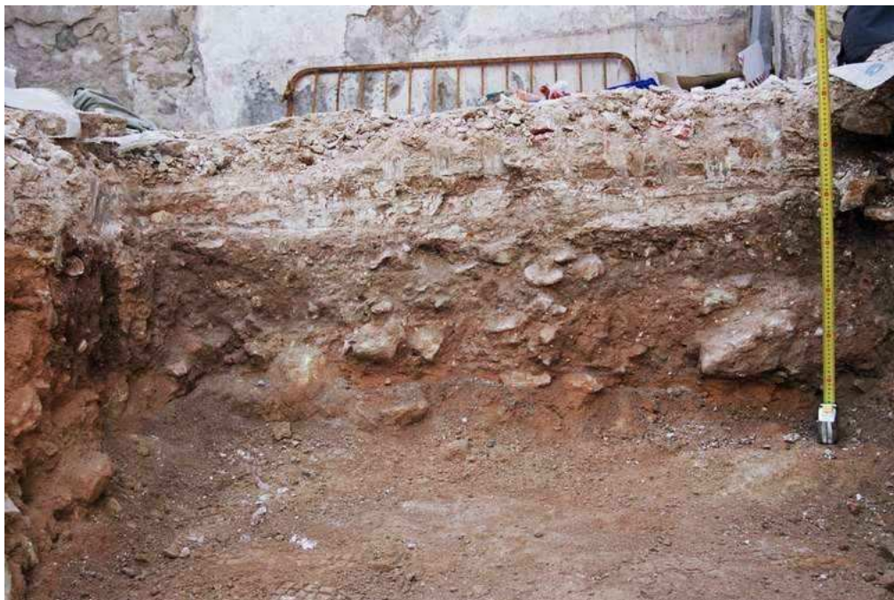
Vista del perfil tras su limpieza