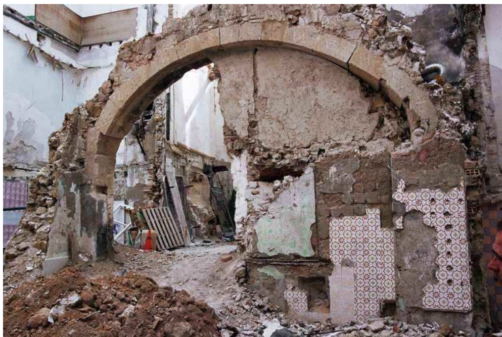
Vista del arco de sillería localizado tras la demolición del inmueble