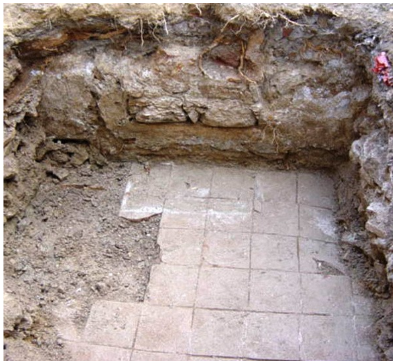
Pavimento de losas (UE 5) y muro (UE 6) con el vano tapiado