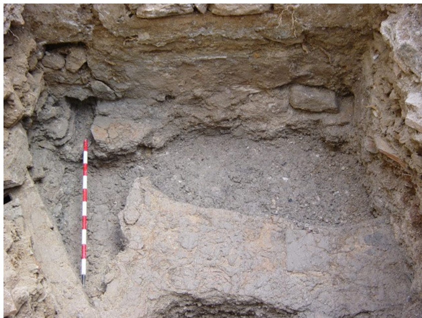
Restos del suelo (UE 7) y, a la izquierda, atarjea (UE 10)