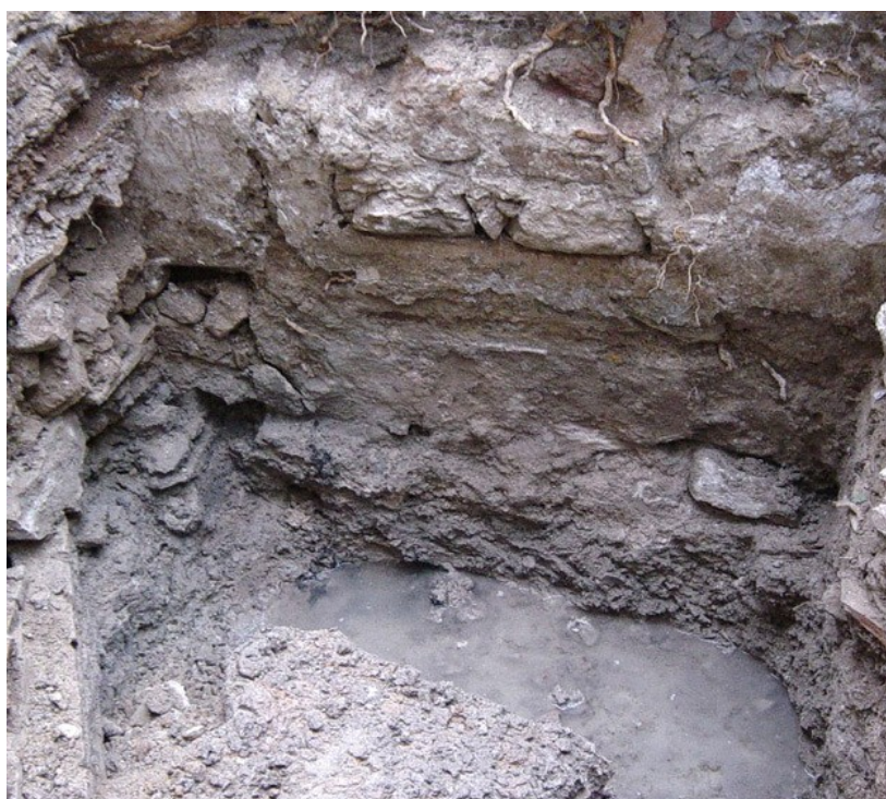
Presencia del nivel freático a -2,00 m