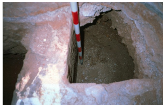
Cata 4. Osario