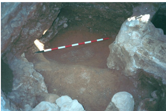
Vista de la Cata 4