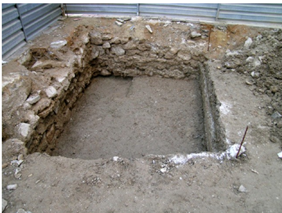
Vista del Sondeo 2