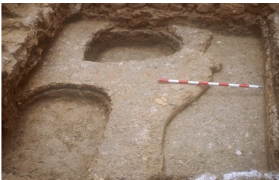
Vista del Sondeo 1