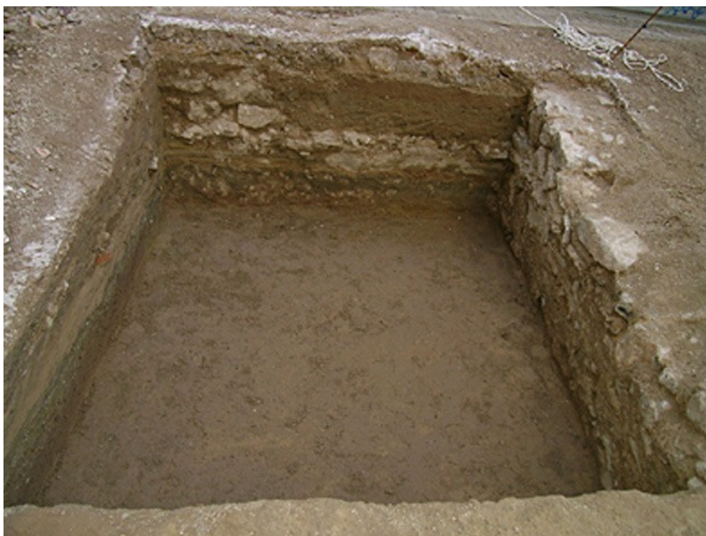
Vista del Sondeo 3