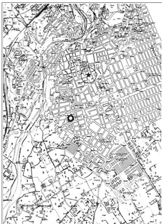
Plano de situación del yacimiento