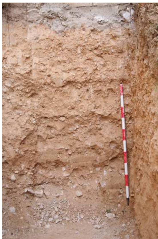
Detalle del perfil norte del sondeo