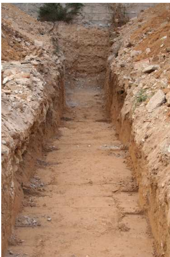
Vista general del sondeo de sur a norte