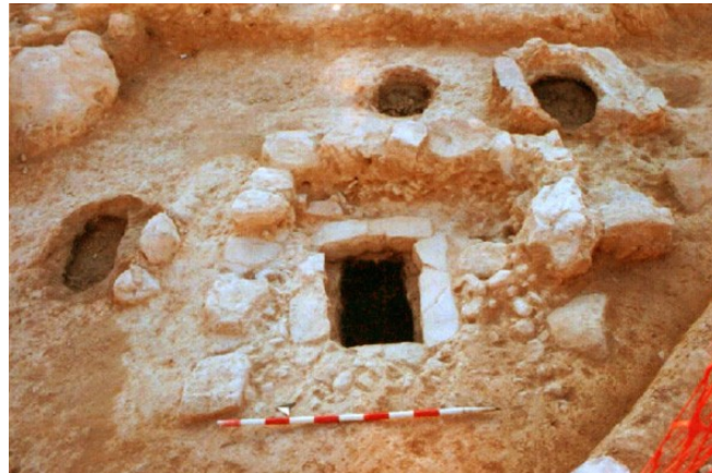
Vista parcial del sector excavado