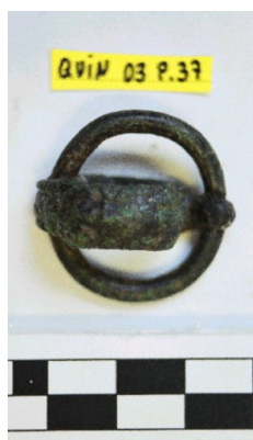
Fíbula anular (Punto 37)