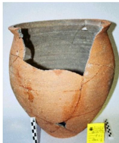
Olla aparecida en el Punto 52