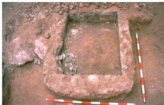
Arqueta de aguas (1960)