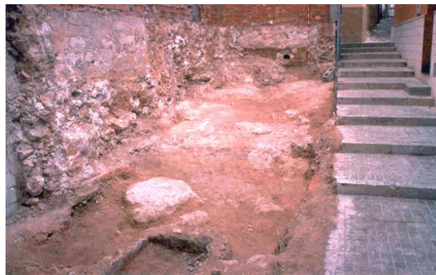
Vista general del solar