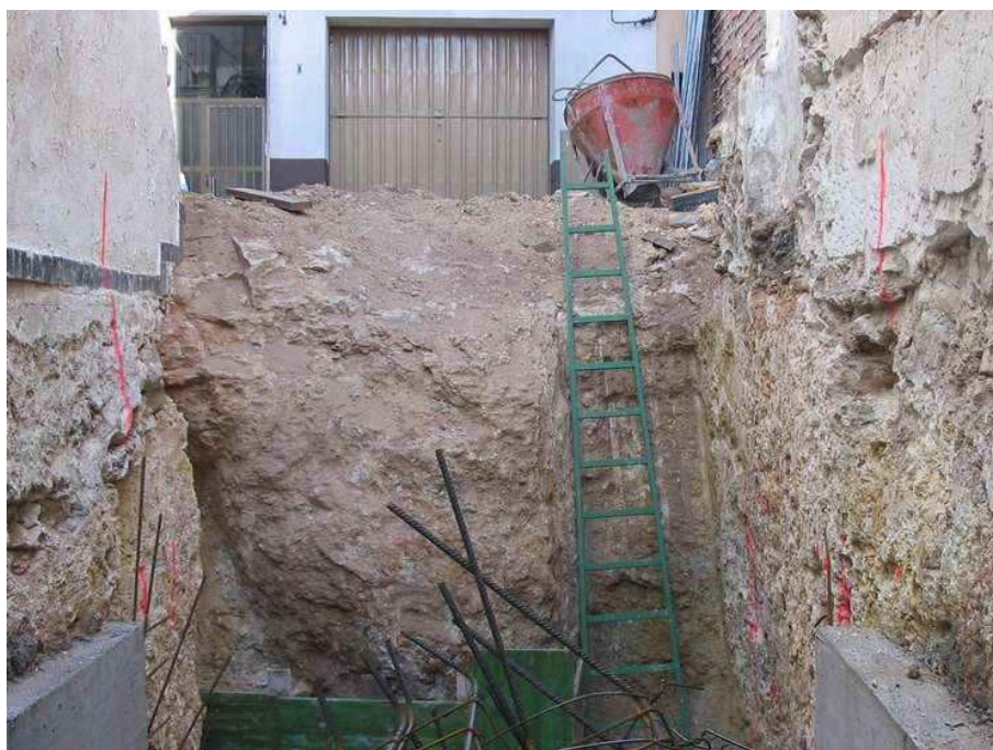
Planta inferior ya rebajada. Vista del recorte de la roca