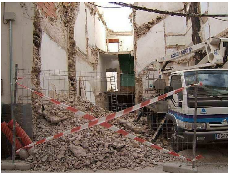
Proceso de derribo del inmueble