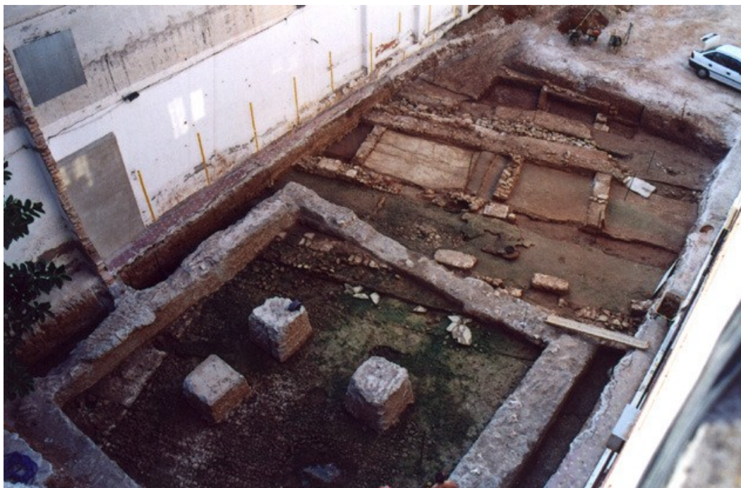
Vista aérea del al-funduq I