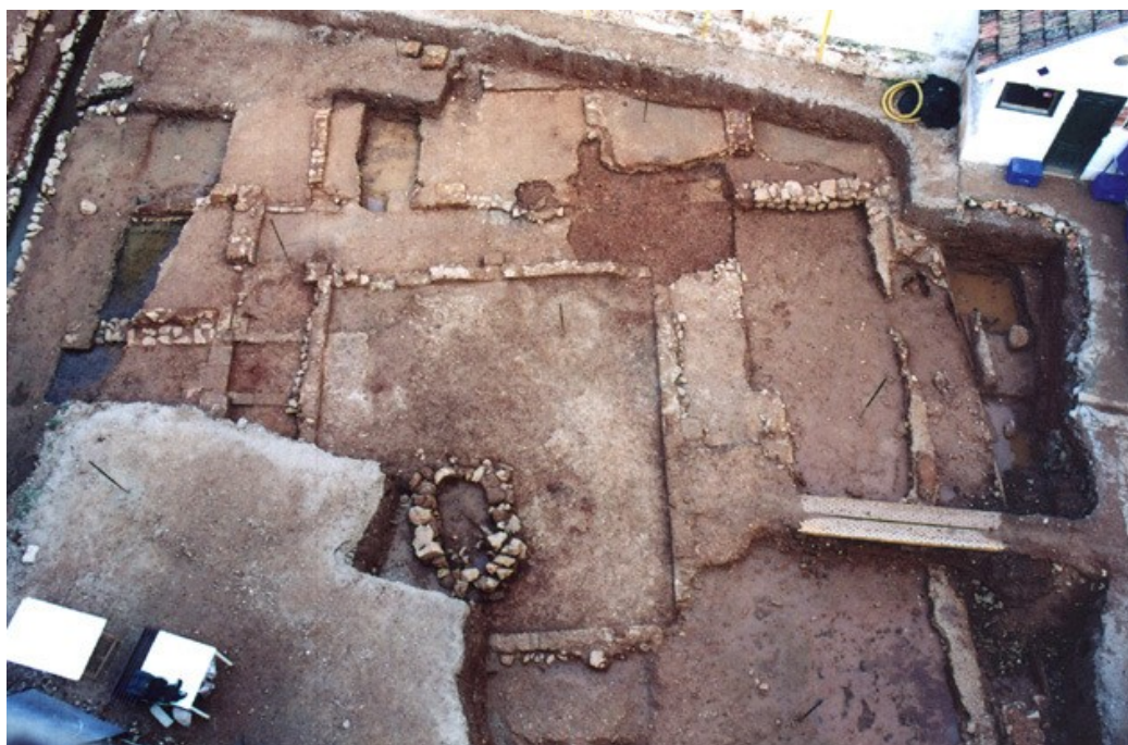
Vista aérea del al-funduq II