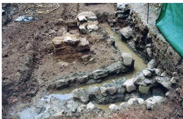
Vial y canaletas