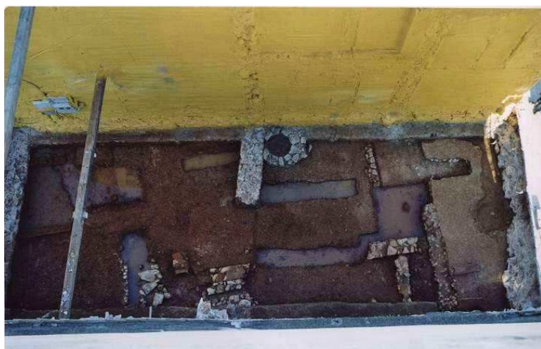
Vista cenital. Manzanas septentrional y meridional. Vial de tránsito