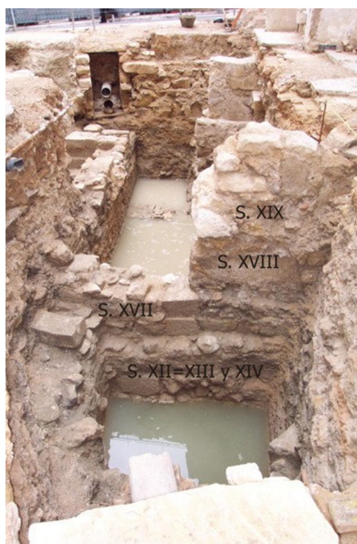
Muro de mampostería islámico con diferentes recrecidos en los siglos XVII-XVIII y por último en el XIX