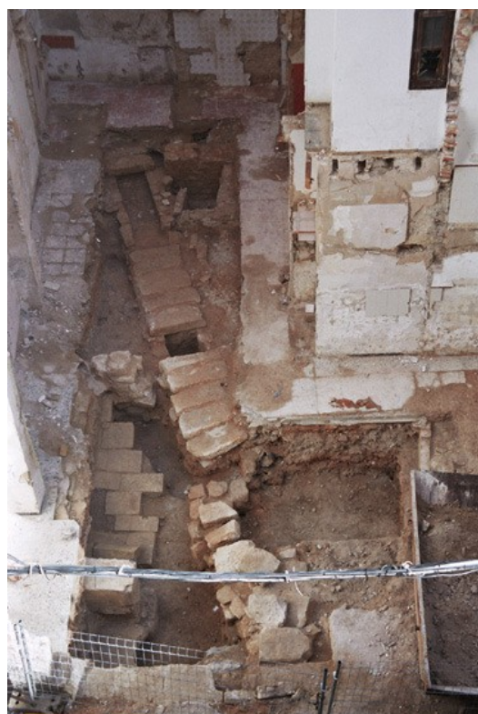
Colector de finales del siglo XIX que atraviesa el solar