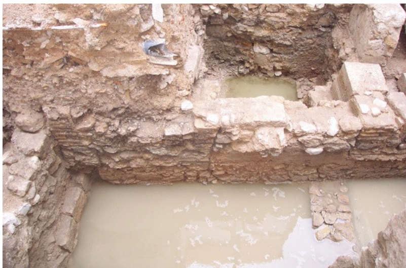
Muro de tapial del siglo XII-XIII, recrecido en los siglos XVI-XVII y aprovechado también en los siglos XVIII y XIX