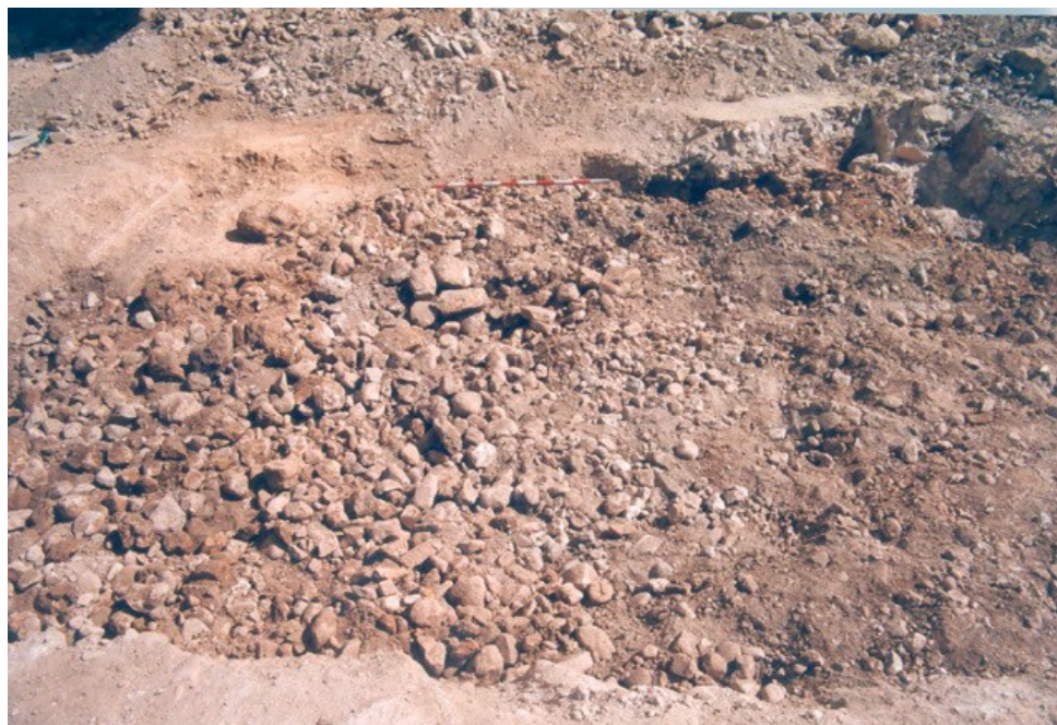
Inicio de la excavación del vertedero moderno en la ampliación del sondeo 2