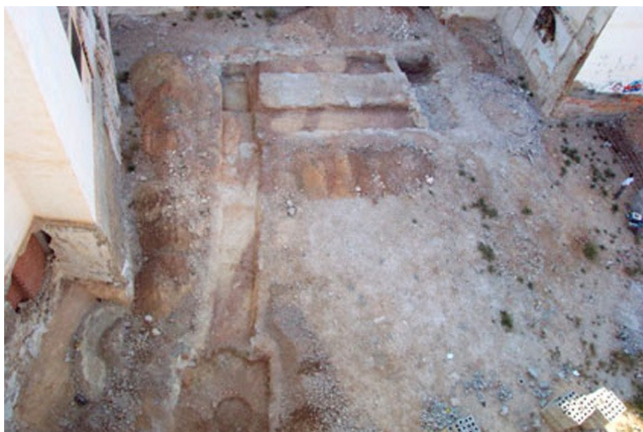
Vista general de los sondeos arqueológicos