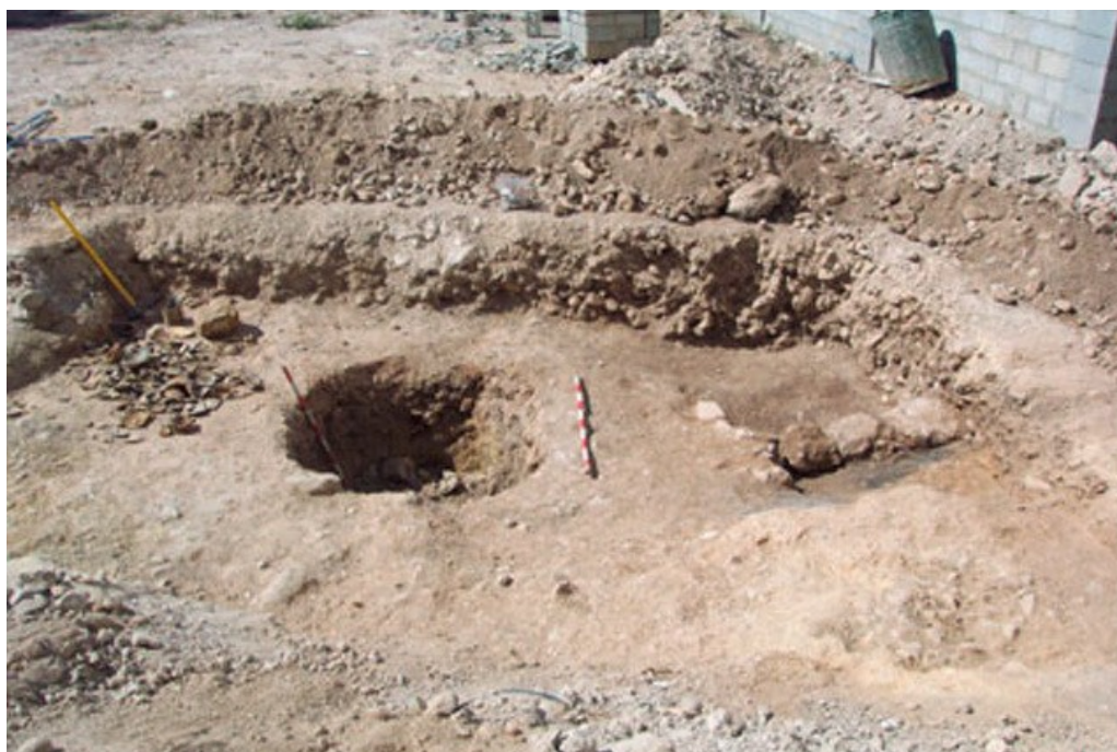
Vertedero moderno, incluido su hoyo, y pequeño estrato residual con material ibérico y bajomedieval