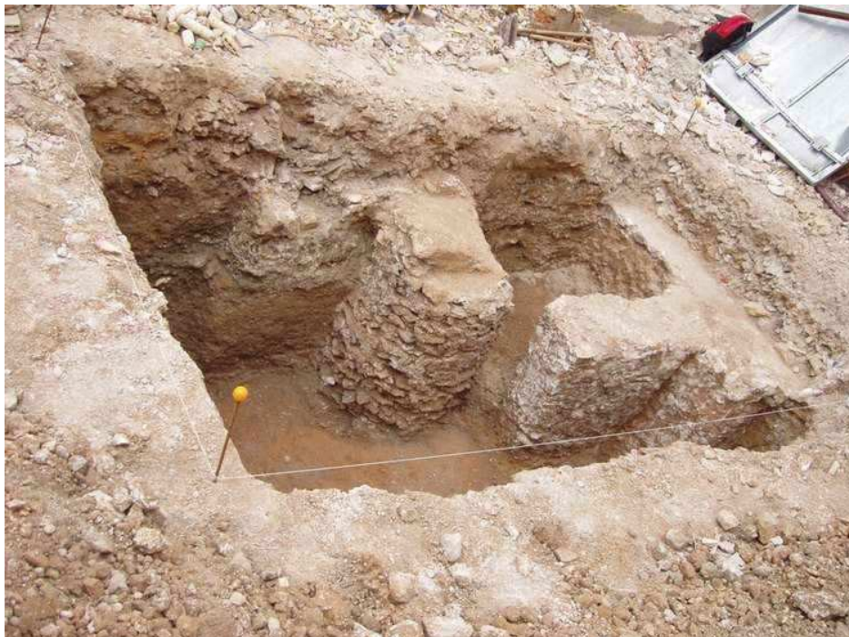
Vista general de la excavación arqueológica