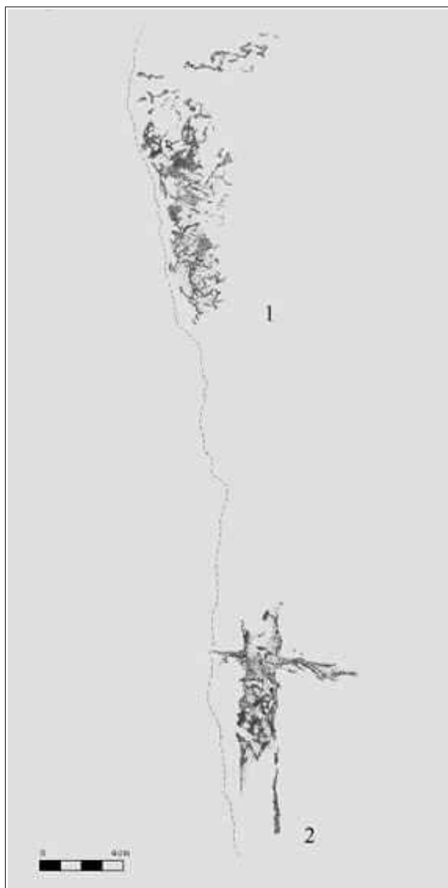
Panel 1 del abrigo II