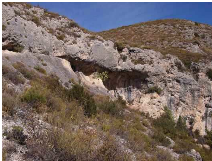
Vista del abrigo I