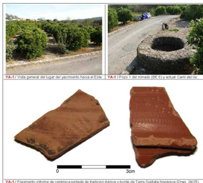
Vistas del yacimiento romano Pou de Baix (Benimeli)