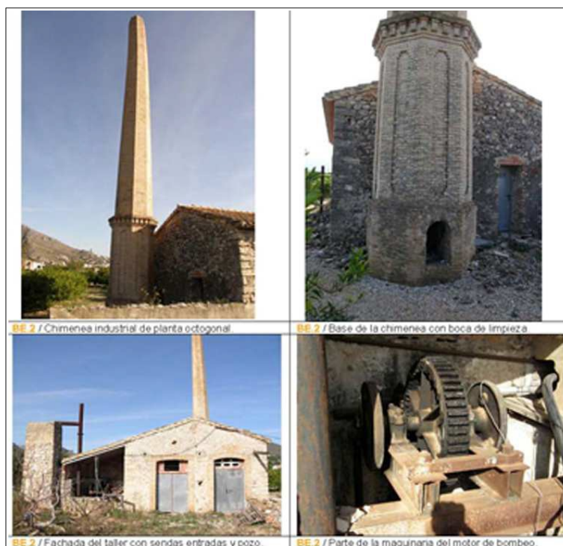
Vistas del taller con chimenea industrial de ladrillos (BE-2)