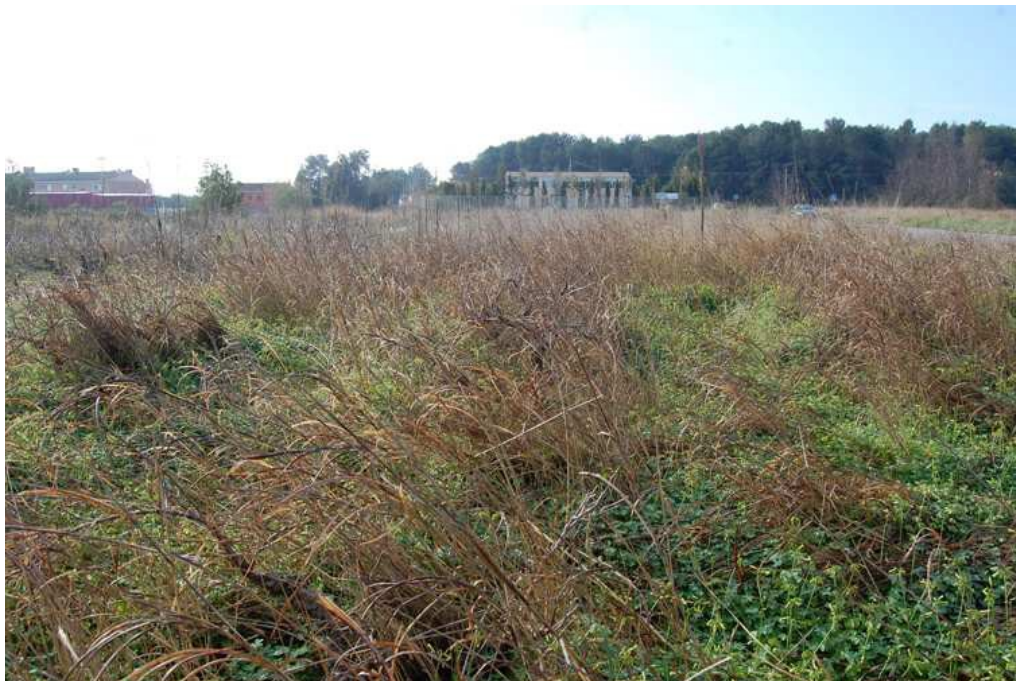
Vista parcial de la zona de intervención