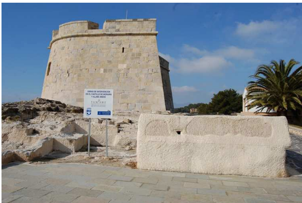
Vista del Castell de Moraira