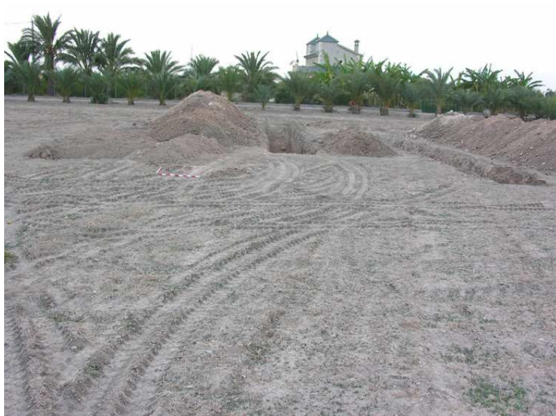
Vista general de los sondeos 1, 2 y 3