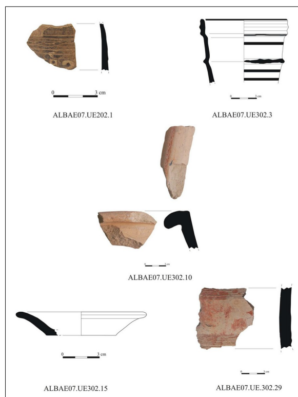
Ejemplo de materiales exhumados en la excavación