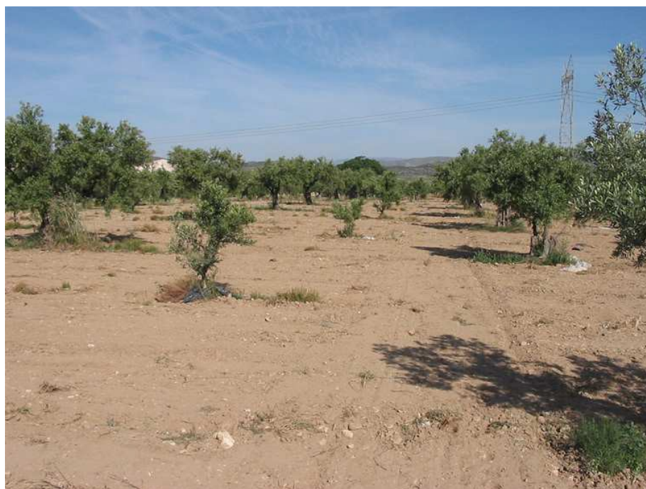
Vista de la parcela prospectada