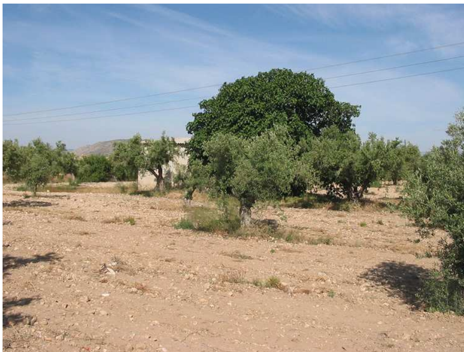
Vista general de la parcela donde se observa el cultivo de olivos