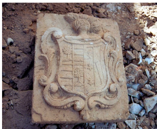
Escudo de la familia Aragonés