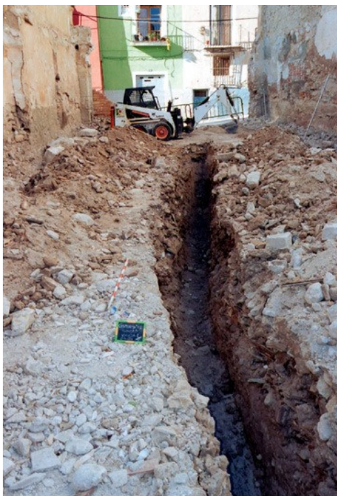
Vista general de la zanja 1