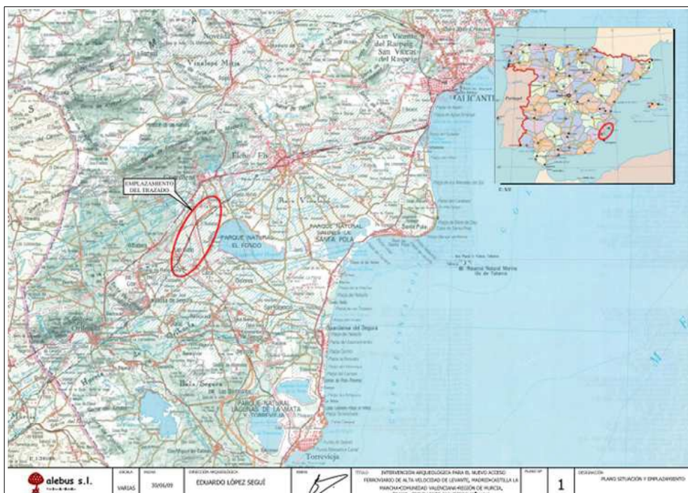
Plano de localización