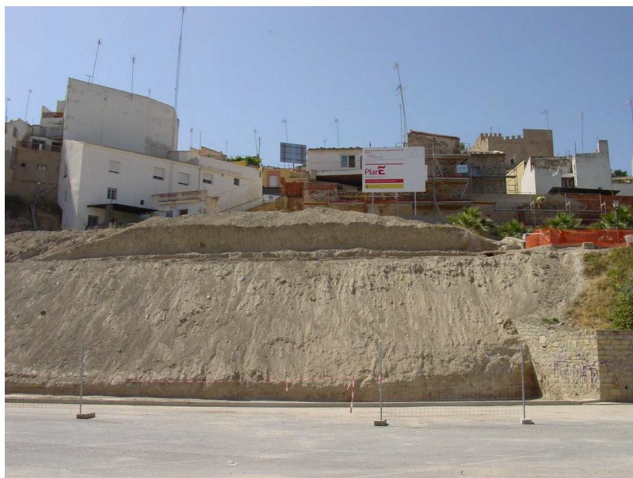
Desmontes de tierra y sección estratigráfica