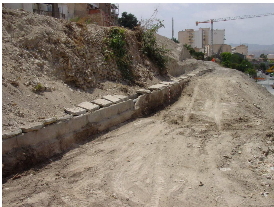
Acequia localizada en las labores de desmonte