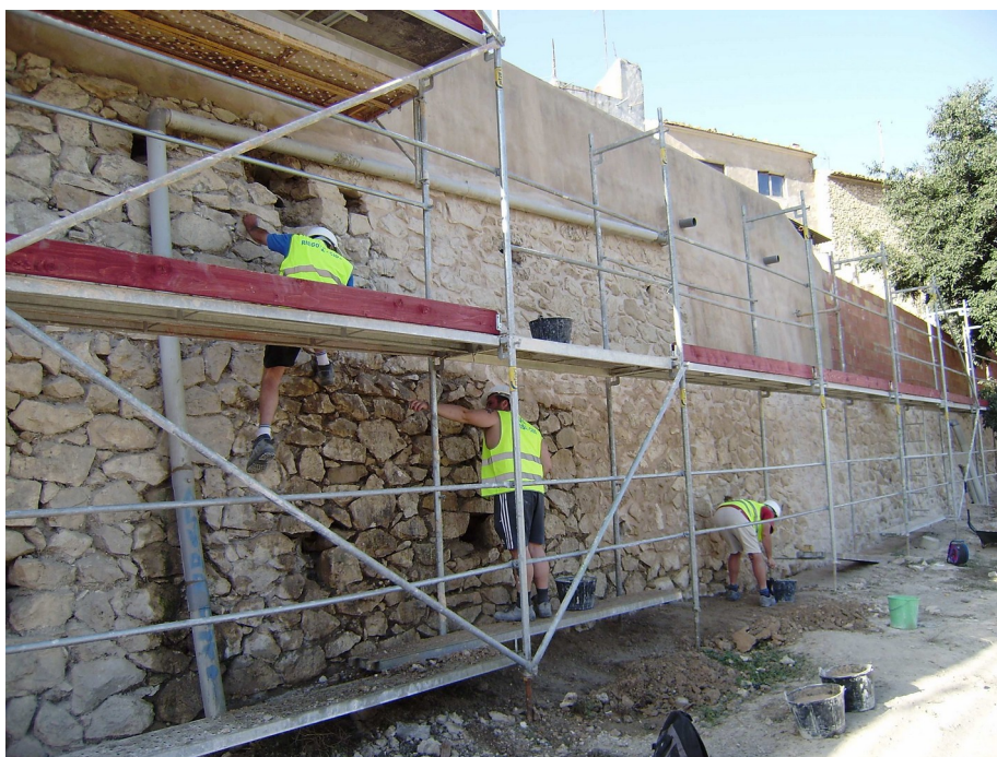
Labores de limpieza y rejuntado de las traseras de las viviendas