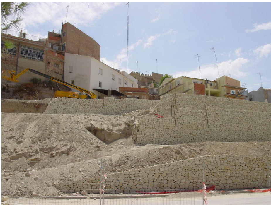
Proceso de elaboración de las terrazas ataludadas