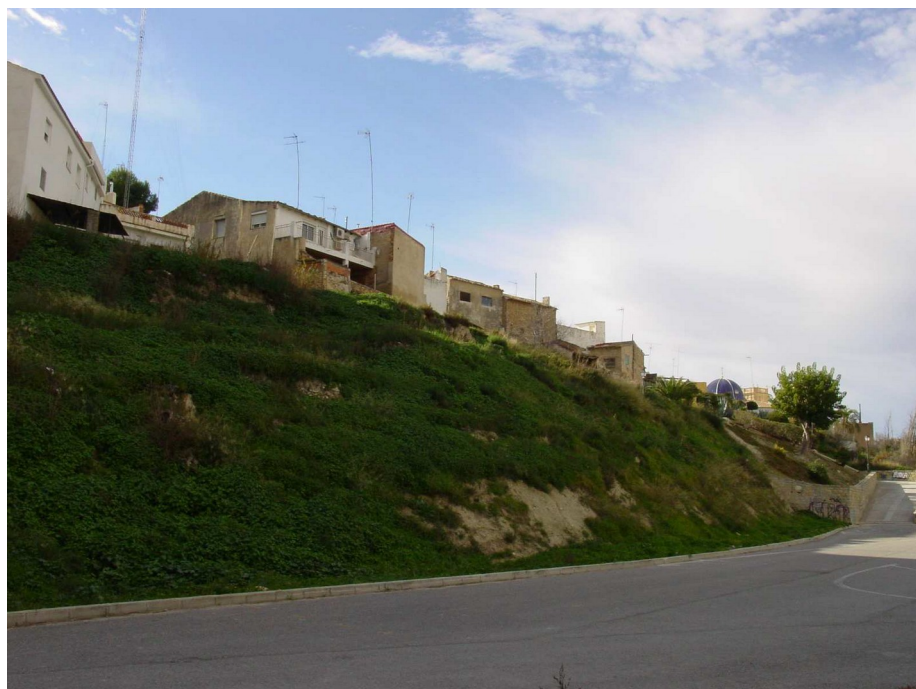
Ladera aterrazada antes de comenzar la intervención