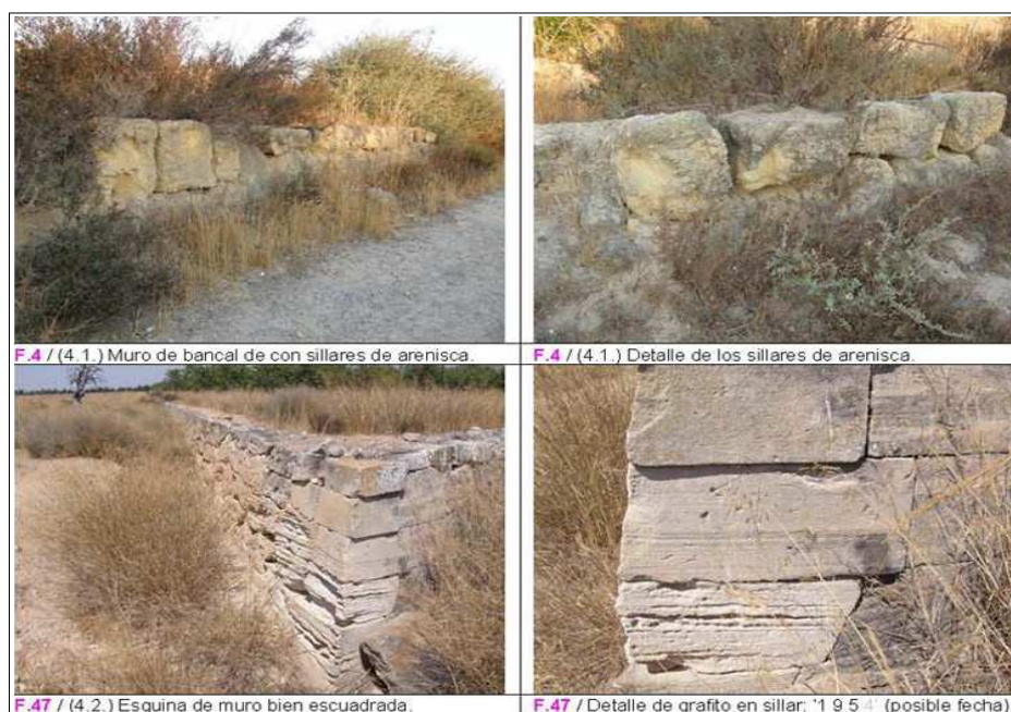
Muros de piedra en seco