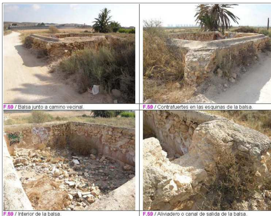
Balsa del camino viejo de El Altet