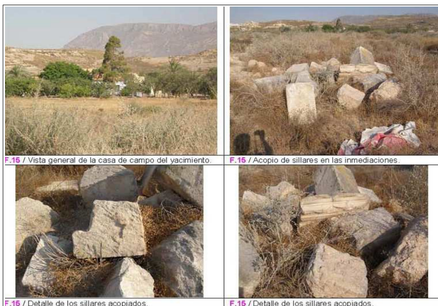
Yacimiento cercano de Casa de la Muerte