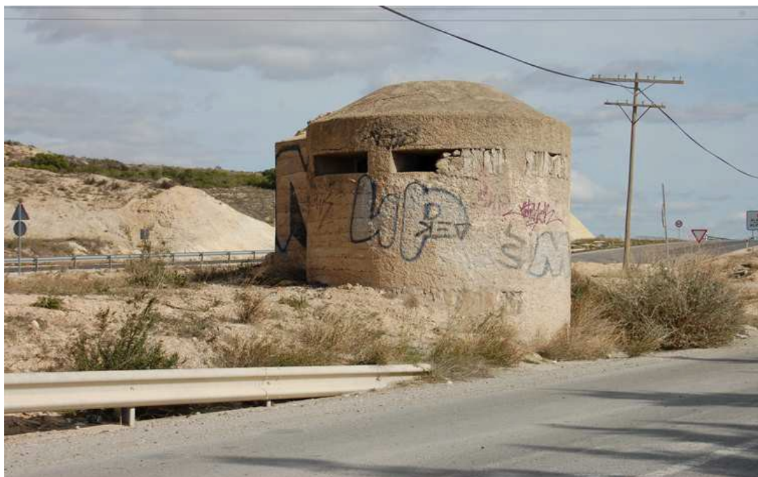
Vista del 10 búnker en WP 14, carretera Camí Vell d'Alacant a Elx