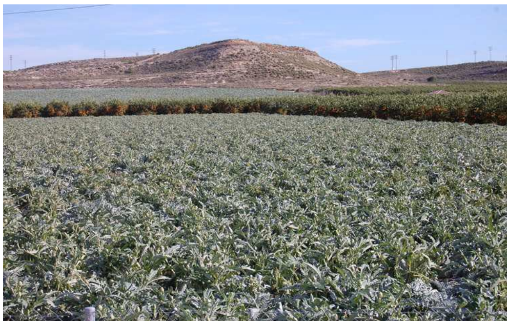
Vista general del área de bancales de regadío (hortalizas)