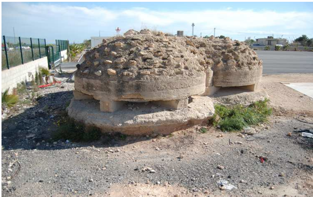
Vista del búnker de las defensas del aeropuerto de El Altet