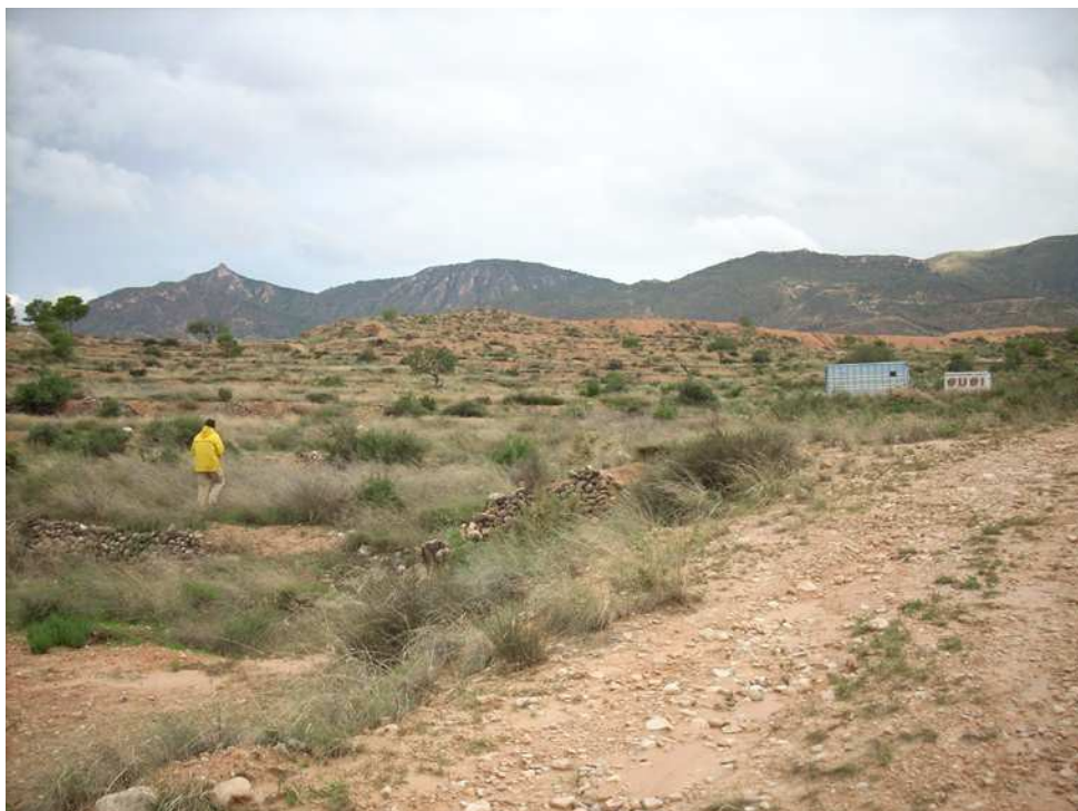
Vista general de la zona prospectada