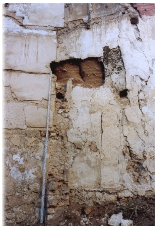
Detalle del muro medianero al N del solar