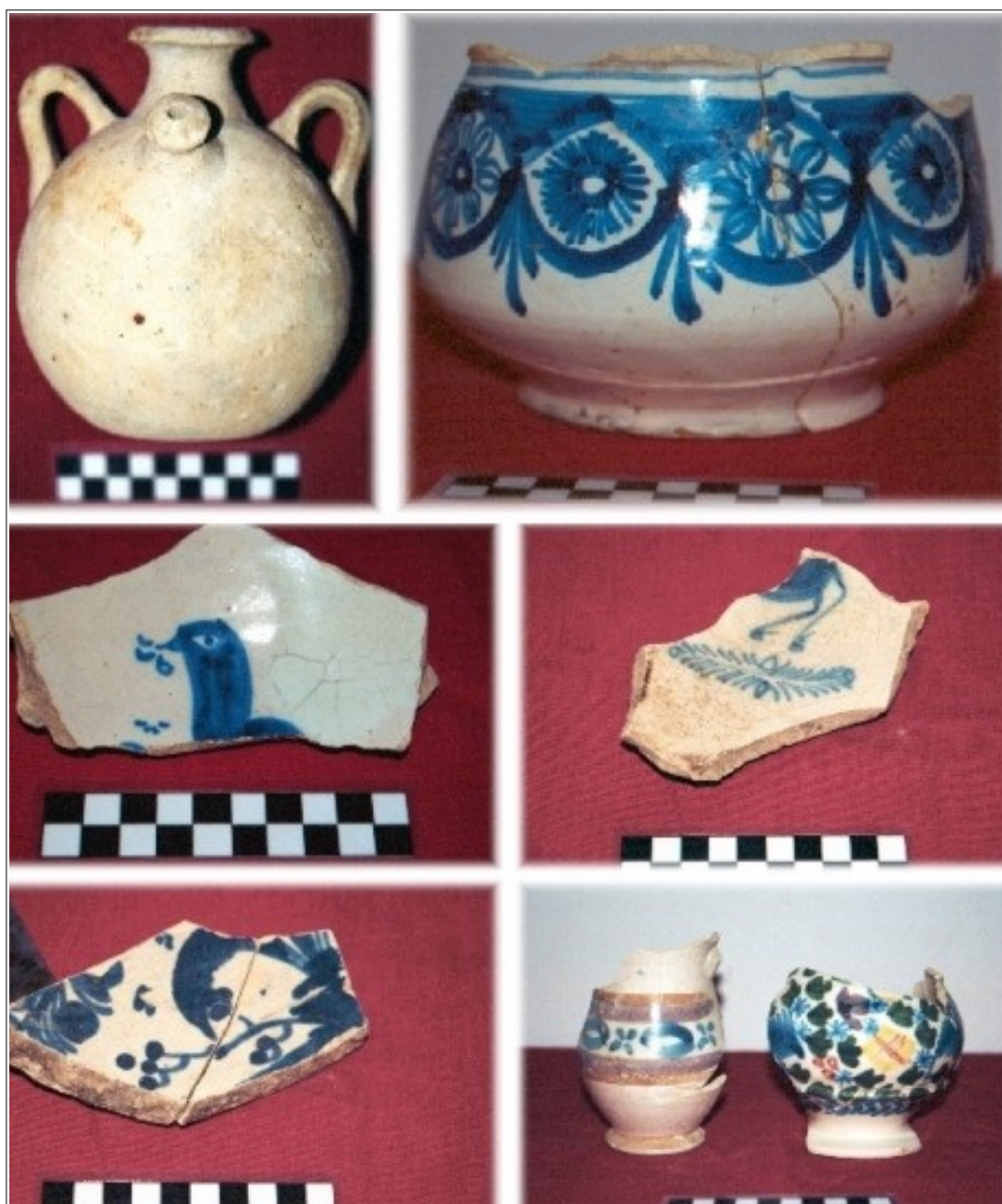
Material cerámico recuperado del interior de los pozos