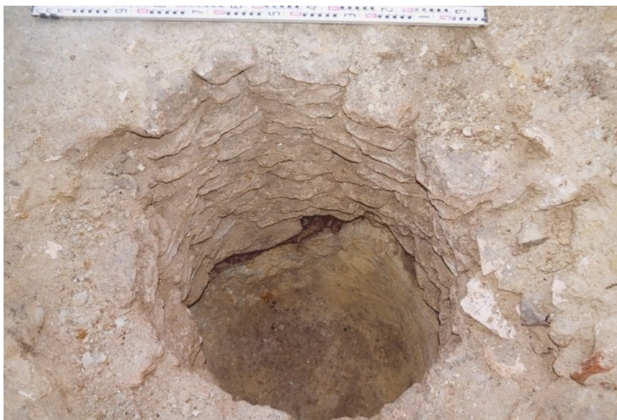
Pozo n.º 2