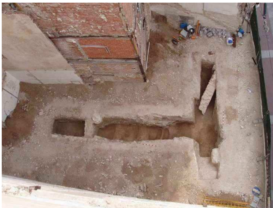
Vista general de los sondeos arqueológicos