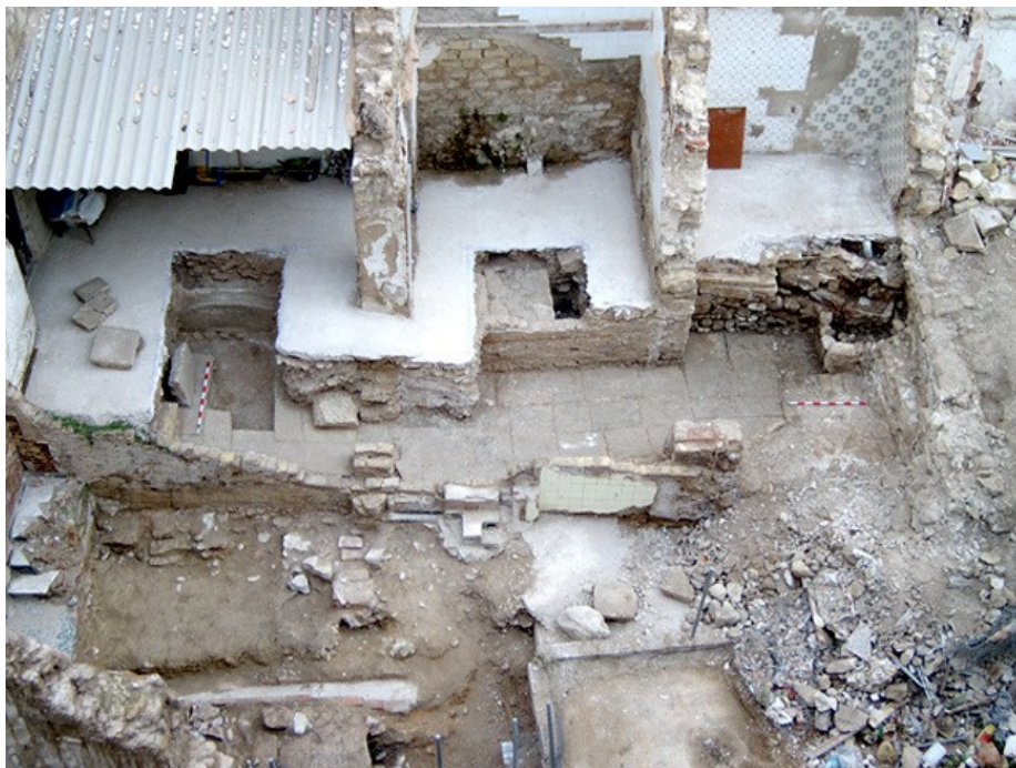
Vista general de la excavación