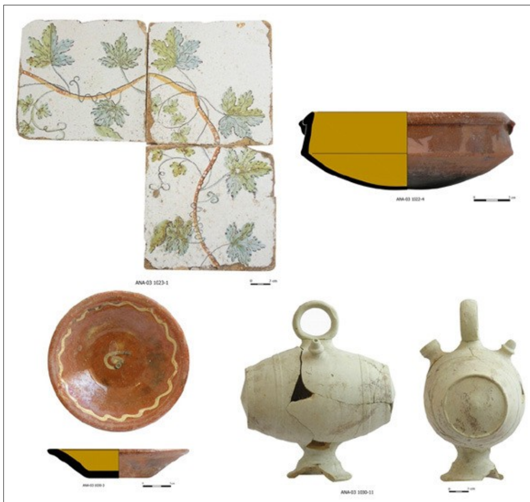
Materiales recuperados en la excavación