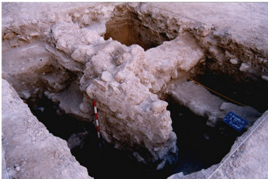
Calle Agustina de Aragón, 13. Corte A. Muros de cimentación de estructuras de habitación no definidas