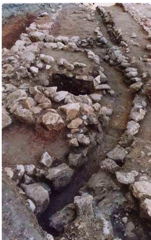
Canales en el vial