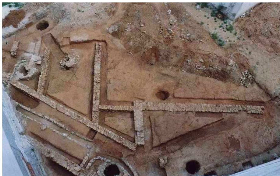
Vista general de la excavación