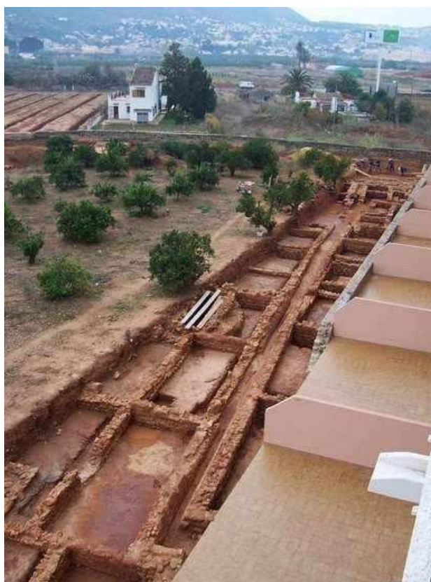
Callejón pluviales. Viviendas bloques n.º 3 y n.º 4. Al fondo la muralla