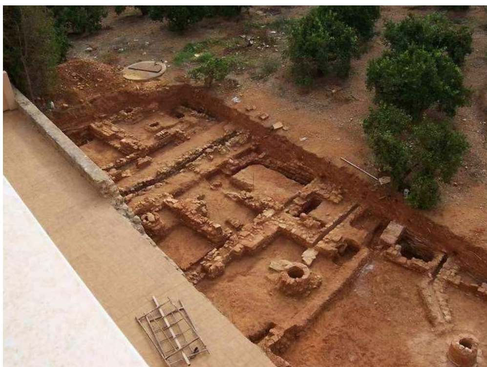
Vial I, viviendas 2, 3, 4 y 5