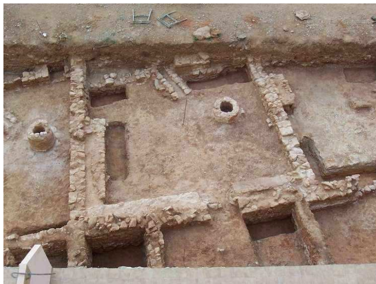
Vivienda n.º 6