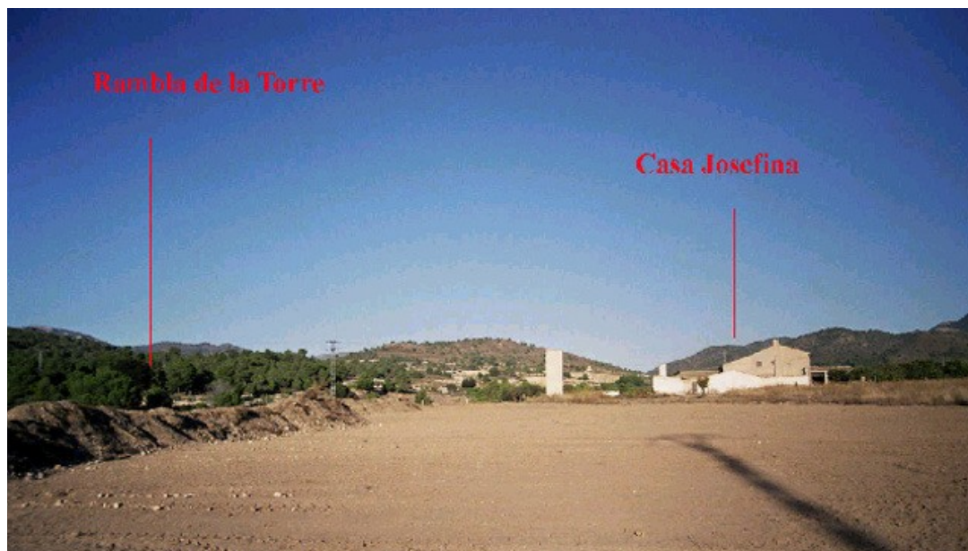
Vista de la Casa Josefina i la rambla de la Torre