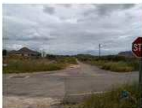
Foto 10. Vista del trazado desde el P.K. 54.750 hacia el Este.