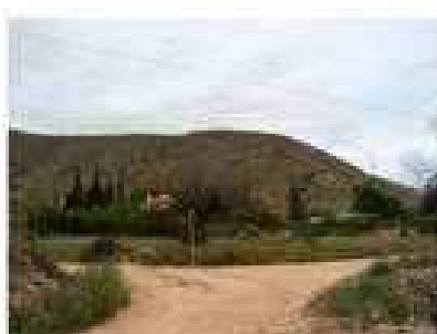
Foto 6: Vista del trazado desde el PK. 52.900 hacia el Noroeste. Al fondo el cerro donde se sitúa el yacimiento de Cuevas de la Semeta Larga, que no se ve afectado por el trazado