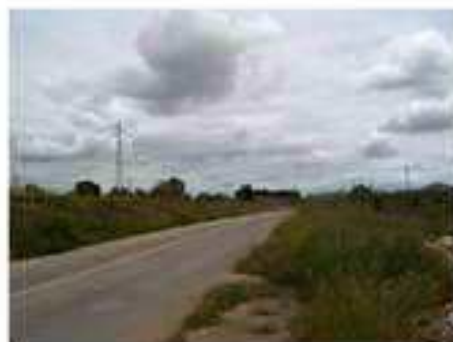
Foto 8. Vista del trazado desde el P.K. 53.500 hacia el Este.