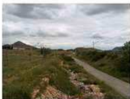
Foto 12. Vista del trazado desde el P.K. 55.100 hacia el Este.