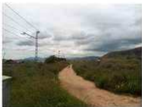
Foto 9. Vista del trazado desde el P.K. 54.750 hacia el Oeste.