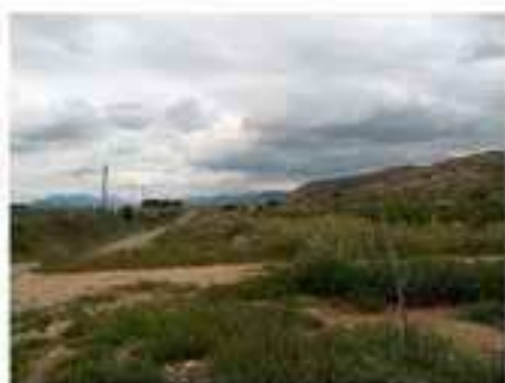
Foto 11. Vista del trazado desde el P.K. 55.100 hacia el Oeste, en su variante hacia Eliche.