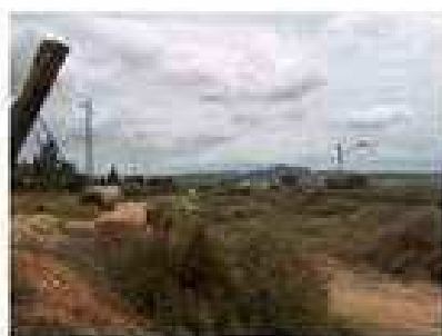
Foto 5: Vista del trazado desde el PK. 52.900 en su desdoblamiento de vía en dirección a Elche y Alicante hacia el Este