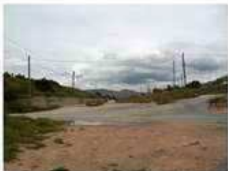
Foto 7. Vista del trazado desde el P.K. 1.000 del acceso a Eliche hacia el Oeste.