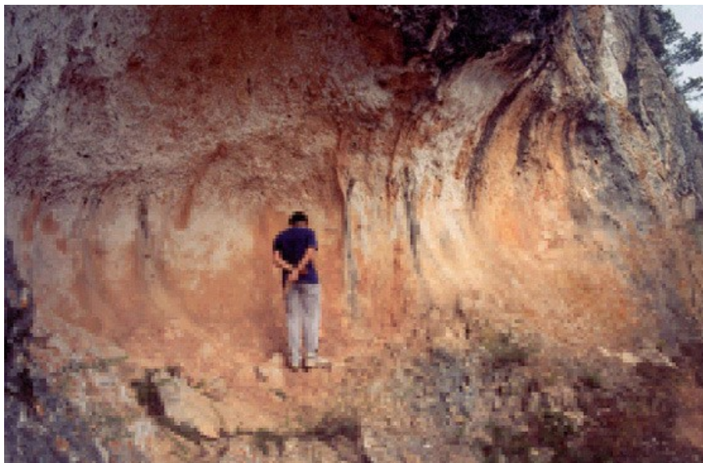
Interior del Abric de Sant Antoni