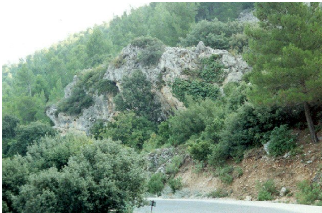
Abric del Barranc de l'Abellar